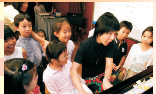
學生試前音樂會及工作坊 8月26日