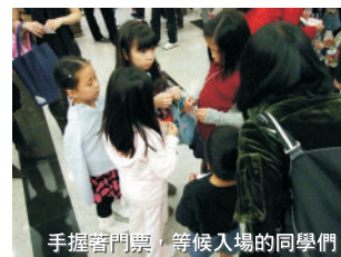
手握手門票，等候入場的同學們

為了鼓勵學生多參與及欣賞各類型音樂會，擴闊同學們的音樂視野，學院一直舉辦不同的音樂欣賞活動，並深受同學及家長歡迎。我們將會繼續舉辦一系列音樂共賞活動，介紹一些很值得同學參加的音樂會，並組團前往欣賞，提高各同學的音樂知識，各同學千萬不容錯過！